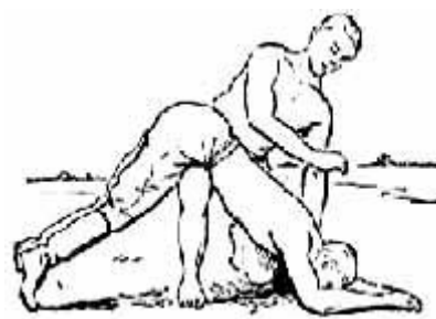
Удаление воды из рта потерпевшего

МКУ «Управление по делам ГОЧС и ЕДДС» МО «Турочакский район» Республика Алтай, Турочакский район, с.Турочак, ул.Советская, д.77 Телефон 8(38843) 22-1-33, или 112.