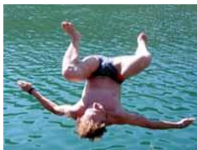
Не ныряйте в непроверенных местах

Для того чтобы избежать несчастного случая на воде лучше всего купаться в специально оборудованных местах: пляжах, бассейнах, купальнях; обязательно предварительно пройти медицинское освидетельствование и ознакомиться с правилами внутреннего распорядка мест для купания, а если таких мест нет, определить место для купания, проверив его с точки зрения безопасности.