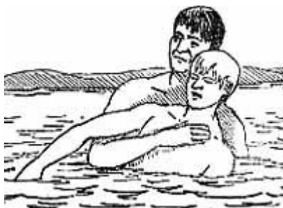
Захват утопающего сзади

Жизнь дается человеку один раз и не надо рисковать ею ради нескольких минут так называемого «экстрима»!