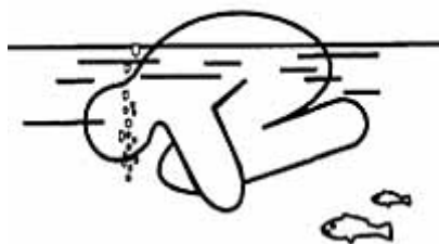
Если нет сил - станьте поплавком

Если что-то произошло в воде, никогда не пугайтесь и не кричите. Во время крика в лёгкие может попасть вода, а это как раз и есть самая большая опасность. Чтобы избавиться от воды, попавшей в дыхательные пути и мешающей дышать, нужно немедленно остановиться, энергичными движениями рук и ног удерживаться на поверхности воды и, поднять голову возможно выше, сильно откашляться. Чтобы избежать захлебывания в воде, пловец должен соблюдать правильный ритм дыхания. Плавая в волнах, нужно внимательно следить за тем, чтобы делать вдох, когда находишься между гребнями волн. Плавая против волн, следует спокойно подниматься на волну и скатываться с нее. Если идет волна с гребнем, то лучше всего подныривать под нее немного ниже гребня.